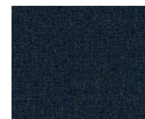
Casual Navy Blue